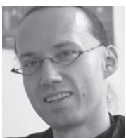
Autor: Peter K. Brandt, Ergon Informatik AG

E-Paper ist den Kinderschuhen entwachsen und in der Geschäftswelt eröffnet sich eine grosse Zahl nutzbringender Einsatzmöglichkeiten. Unternehmen aller möglichen Branchen können vom Einsatz mobiler Geräte mit Geschäftsanwendungen auf der Basis von elektronischem Papier profitieren, indem sie ihre Prozesse im Feld damit optimieren. Gerade was optimale Lesbarkeit auch unter widrigen Bedingungen, geringes Gewicht und lange Betriebsdauer angeht, bringen E-Paper gestützte Lösungen viele Vorteile mit sich.