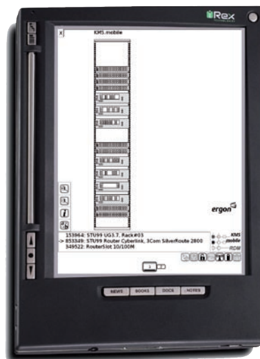
Abbildung 3: Mobiles Netzwerkmanagement, Schrankansicht

Um aufzuzeigen, welches Potenzial in derartigen Field Force-Applikationen auf Basis von elektronischem Papier steckt, hat der Autor eine im gleichen Hause entwickelte Netzwerk-/Kabelmanagement-Lösung und Auftragsverwaltung um einen Prototyp für den mobilen Einsatz erweitert. Ein Beispiel für eine Ansicht des Mitarbeitenden im Feld ist in Abbildung 3 dargestellt. Insbesondere der hohe Detailreichtum des eingesetzten Displays (rund 160dpi bei 768x1024 Bildpunkten)