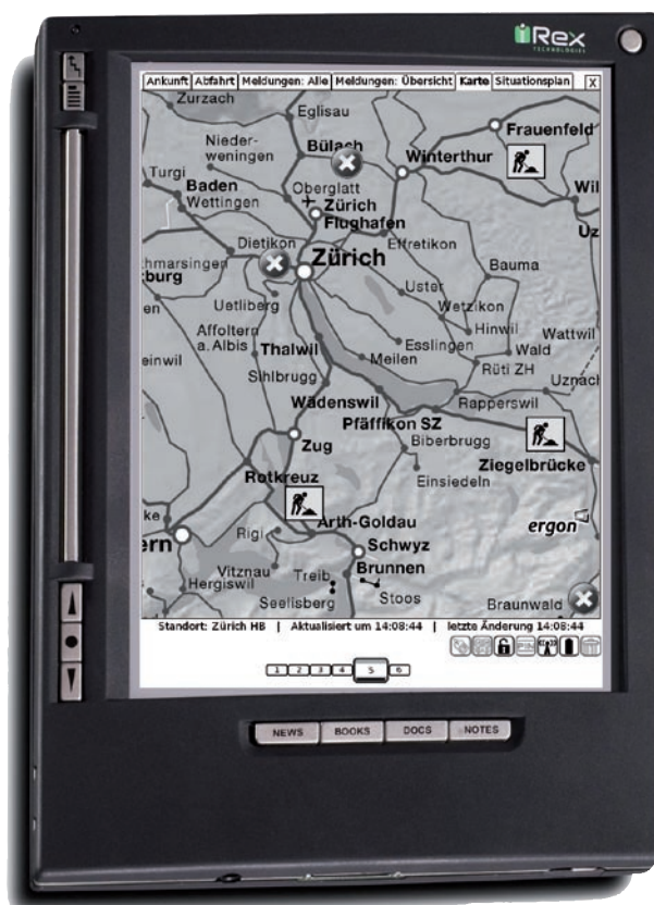
Abbildung 1: Kundenberater- Tool der SBB mit Streckennetzplan

Welcher besondere Kundennutzen mit derartigen Lösungen entsteht, zeigen deutlich zwei Anwendungen, die bei der Zürcher Ergon Informatik AG entwickelt wurden. Basierend auf einem Anwendungsfall der Schweizerischen Bundesbahnen SBB wurde eine Lösung erstellt, welche die Kundenberater und Kundenlenker vor Ort im Fall von Störungen optimal mit Informationen versorgt. Die Aufgabe der Mitarbeitenden im Feld ist es, den Fahrgästen und anderen Interessierten möglichst exakte und zeitaktuelle Informationen